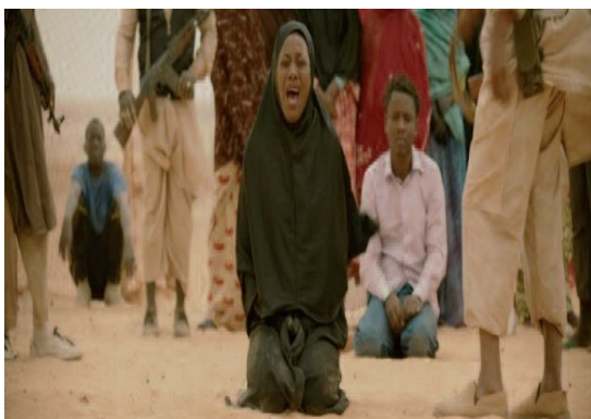
[9] La femme fouettée pour avoir été surprise en train de chanter et qui chante encore sous la douleur.

« Les formes de vie constituent (au moins provisoirement) le dernier niveau d'intégration de toutes les autres sémiotiques ; elles intègrent et subsument, sans les réduire, des textes, des signes, des objets, des pratiques et des stratégies ; elles portent des valeurs et des principes directeurs qui tentent en cohérence tous les autres plans d'immanence ; elles se manifestent par des attitudes et des expressions symboliques ; elles influent sur notre sensibilité, sur nos positions d'énonciation et sur nos choix axiologiques. Elles sont en somme les constituants immédiats de la sémiotique, car elles déclinent, à l'intérieur d'une société donnée, différentes manières de s'identifier au "soi", différentes manières de faire l'expérience des valeurs. » (Fontanille, 2015 b : 6)