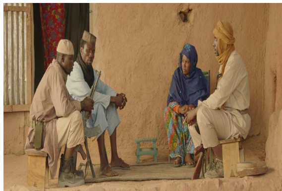
[10] La mère qui refuse de donner la main de sa fille malgré les intimidations des djihadistes venus armés.

Cinétismes (varia), Vol.1 – n°2, février 2023