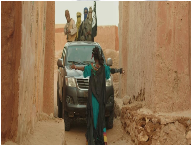
Zabou la folle qui barre la route aux djihadistes. [6]