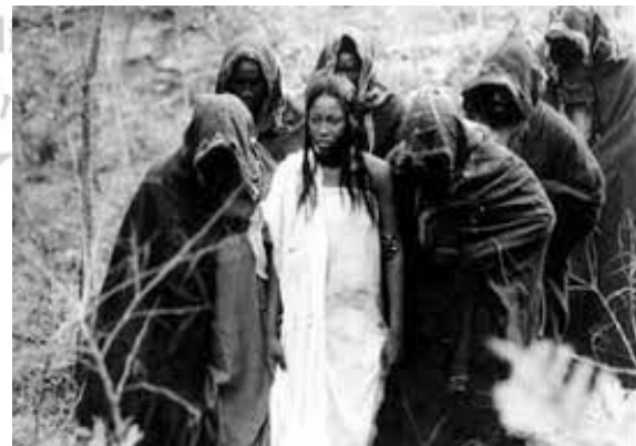
Perquisition du domicile des Penda suivie de leur arrestation. [1] Sia en train d'être conduite vers la grotte de la mort. [2]

Par ailleurs, la femme est présentée dans cet espace filmique comme une amazone, une guerrière qui joue le rôle de précurseur des luttes pour la défense de la liberté d'expression et des libertés collectives. Elle a tendance à user de tous les moyens à sa disposition pour aboutir à la nécessaire émancipation des peuples évoluant dans une société égalitaire fort humanisée. Dans le film Guimba , Sadjo asservie et dépersonnalisée par Guimba le tyran a finalement participé à la déstabilisation de dictateur. Orgueilleusement habillée, elle a dû user de ses appas, son charme et ses rondeurs, pour troubler et appâter son ancien maître. Elle paraissait